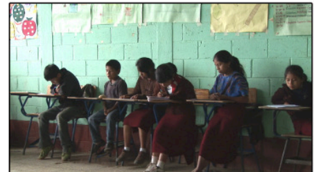
In der Schule

Wie kommst du in die Schule? Macht dir der Schulweg Spaß? Warum/Warum nicht? _____