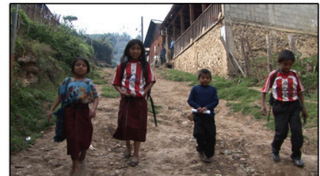
Auf dem Schulweg

Jeden Morgen gehen die Kinder _____ in die Schule. Sie brauchen dafür _____ In ihrer Stadt gibt es keinen _____. Viele Eltern haben kein _____. Es macht den Kindern _____ zu Fuß in die Schule zu gehen.